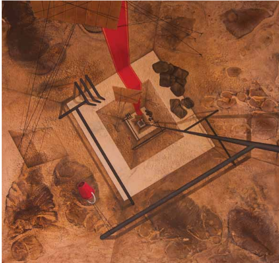
«تاریخ»، اکریلیک روی بوم، ۱۶۰x۱۵۰ سانتی متر، ۱۳۹۳